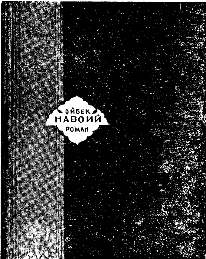
Ойбек «Навоий» романининг 1944 йил нашр нусхаси.