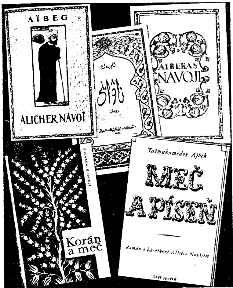
Ойбек «Навой» романининг чет элларда нашр этилган нусхалари.