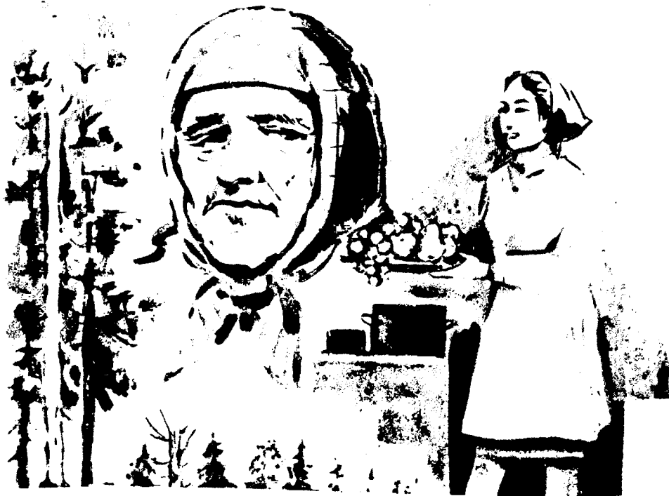
Расмларни А. Холимов чизган

либ кетди» дедингиз-ку! Гапиринг, ҳарна ичингиз ғамдан бўшагани яхши. Гапиринг, опагон!