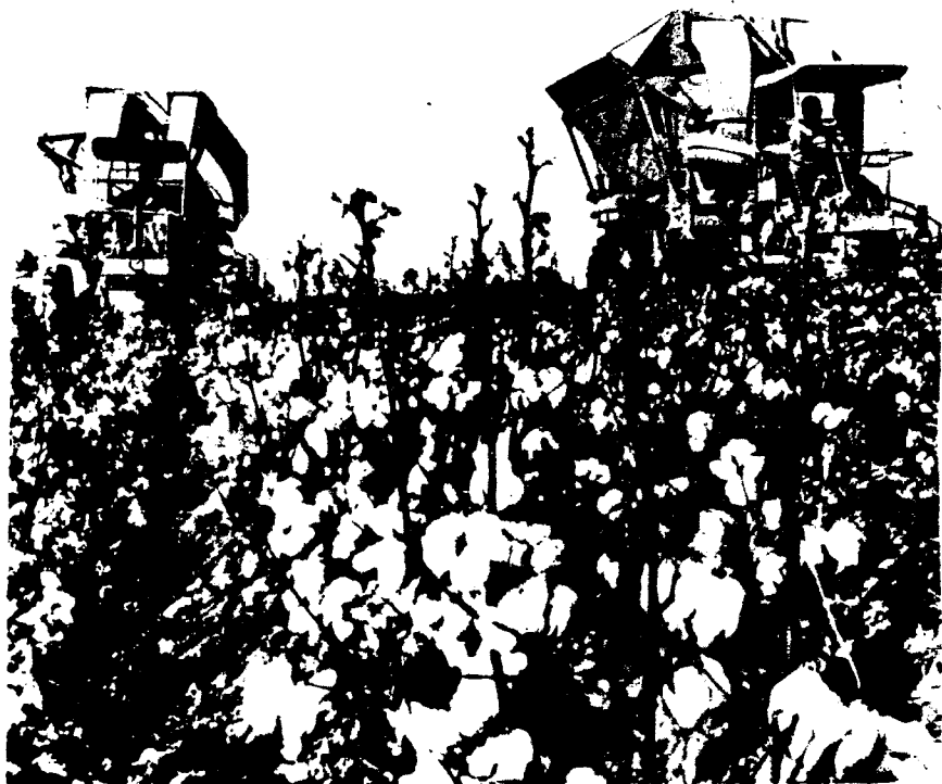
Оқ пахтамик, оппоқ пахтамик.

Шундан бери Чондродипда Бибҳа қайиғи келиб тўхтаган соҳил «Бибҳа соҳили» деб аталадиган бўлди.