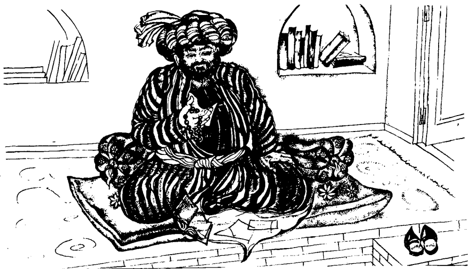
Расми Одил Бобононов чизган

Эси ўзига келгач, указни буклай бошлади. Указ: «Мени кўрма ҳам куйма!» деган каби бўлиб ўз-ўзидан шалдировсиз буклана бошлади. Отин ойм, указни сандиққа олиб кетмак бўлганида, орқасидан яхши қол, деган каби маънос бўлиб қараб турар эди. Яна бир қаттиқ оқ тортгандан сўнг оқ подшони ўрнидан туширганлари учун мастравойларга лаънат ўқиди.