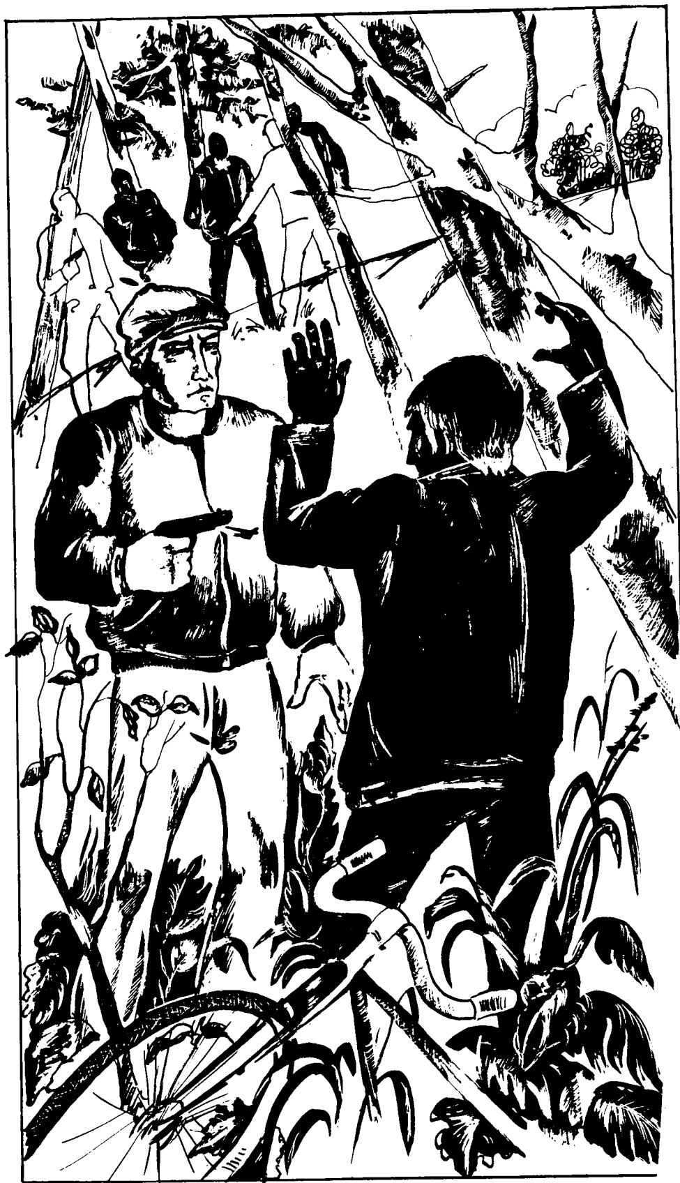
Расми Аваз Шоалимов чизган