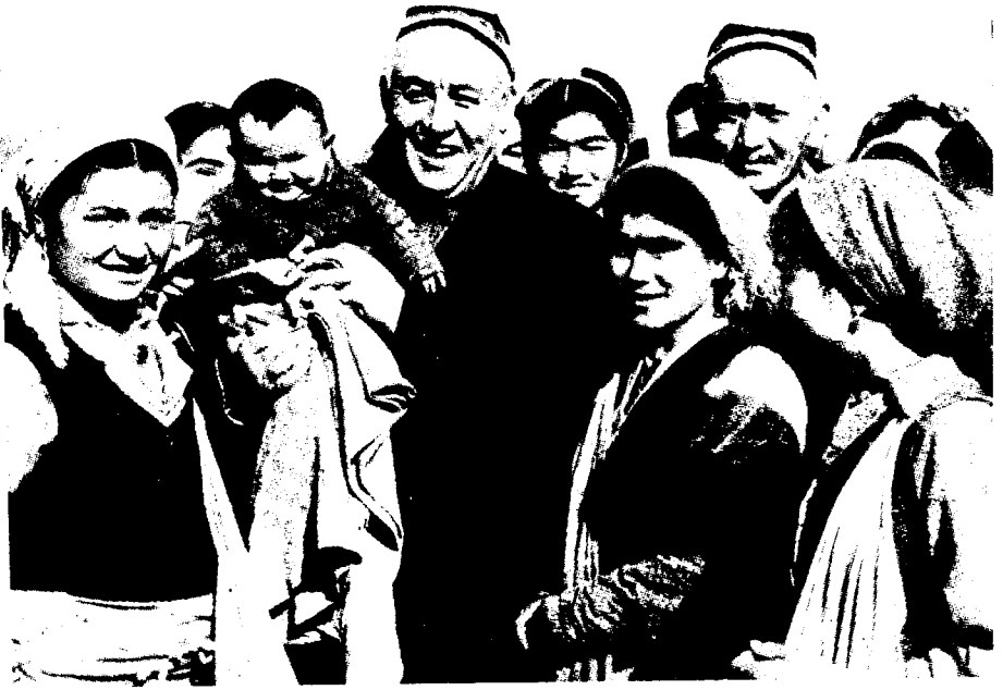
Уйғун Фарғона область Ленинград райони меҳнаткашлари даврасида. 1971 йил октябрь.

масалаларга, хушомадгўй, таъмагир, текинхўр одамлар, ярамас, золим кишилар образини яратишдаги маҳоратини кўрсатишга катта аҳамият беради. Дин арбоблари, шайхлар, зоҳидлар кескин танқид қилинган ўринларни мароқ билан таҳлил қилади.