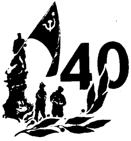
График расом Абдуқаҳдор Маҳкамов иждидан