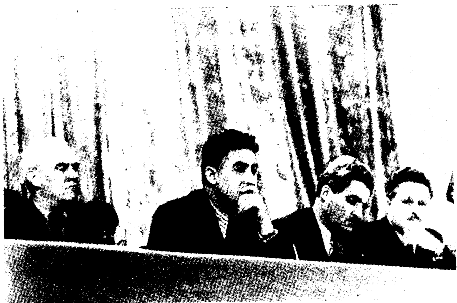
Николай Тихонов, Уйғун, Константин Симонов, Нозим Ҳикмат 1951 йил декада, Москва.

Ҳазорасп тарихий шаҳар. Хоразм воҳасининг Қорақалпоғистон билан Туркменистон ер-ларига туташган жойда, қадимий ипак йўлларидан бири устида жойлашган. У илгаридан ўз оқ олтини, чорваси, ширин-шакар мевалари билан машҳур. Хоразмнинг ҳосилдор, бой ер-лари, машҳур Боғот, Хонқа боғларини босиб ўтар эканмиз, шоир Хоразмий, Беруний, Ибн Сино, Огаҳий, Аваз, Шероз, Ҳожихонларни ўйлатган, қуйлатган, ҳайрон қолдирган, курашга чорлаган юртни, унинг тарихини ўйлар, яқин-яқинларда ўзи катта илҳом билан қоғозга туширган ва сахна санъати орқали халққа манзур бўлган Беруний, Ибн Ино ҳақидаги асар-ларни хаёлига келтирарди.