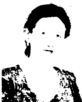
Набийра Тўрешова, Қорақалпоғистон халқ шоири