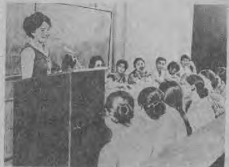
1971 йил. Қишлоқ хўжалиги инсти-тутида учрашув.