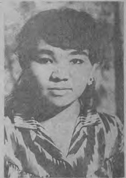
Дорилфунуннинг журналистика куллиётида, 2-курс.