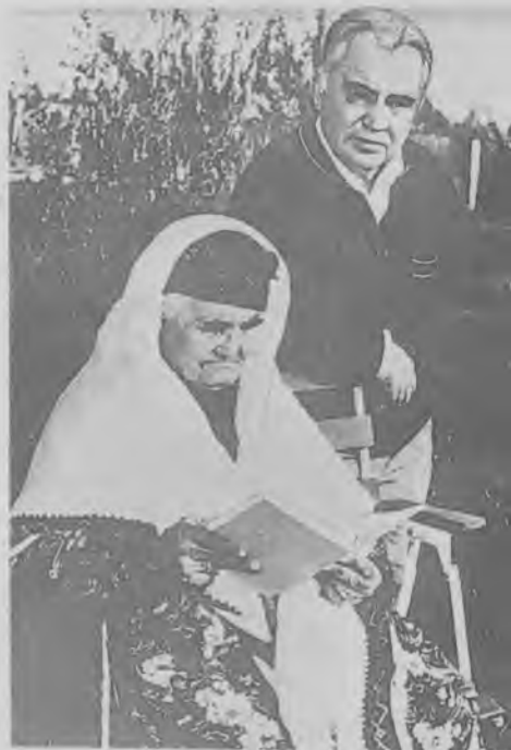
Миллий олий мактаб студентлари ва янги ёш зиёлиларнинг шаклланишига бағишланган "Уч илдиш" романи менга жуда ёқди.

— Мақтовингиз учун раҳмат, бироқ Париж бизга жуда узоқ, — дейди. — Биз ҳозир мана шу Тошкентга муносиб бўлиш