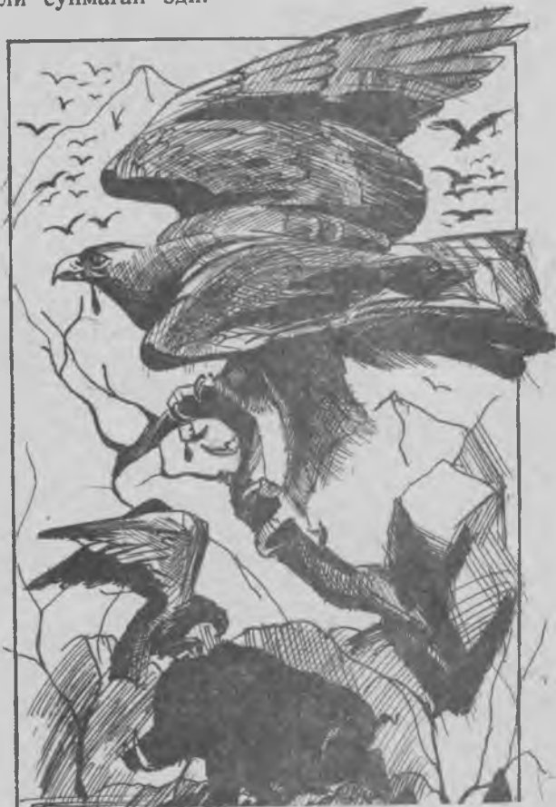
Рисми А. Мамасалиев чизган.

Ўлаксахўр ва ғажирлар қий-чув солиб кўкка кўтарилди. Осмонни қора кўланкалар қоплади. Улар тўқай томон эниб кела бошладилар. Лекин шу кеч ва эртасига ҳам тўдадан бирор қуш ажраб чиқиб, машъум жангтоҳга қўна олмади. Чунки бургутнинг очиқ кўзларидаги яшил аланга ҳали сўнмаган эди.