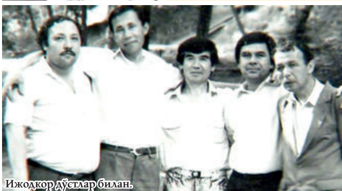
Ижодкор дўстлар билан.

Машираб ака “Сўз” деб аталмиш китобларининг биринги саҳифасидаги шеърда навбатдаги сўзларининг яхшими ё ёмон эканини билмаганларини айта туриб: “Унда биронта ҳам ёлгон йўқ асло, марҳамат, сўз биздан, сиздан-ги, баҳо”, деб ёздилар. Мен 1978 йилнинг баҳоридаяқ бу китобга “аъло” баҳо қўйиб эдим, ҳали ҳам бу баҳодан тонганим йўқ. Бу баҳо мен дунёдан ўтиб кетганимдан кейин ҳам қолади. Чунки “Ўзбекистонда хизмат кўрсатган яхши одам” Машираб Бобоевнинг асарларига фақат менгина эмас, халқ “аъло” баҳо қўйган. Халқ эса адашмайди.