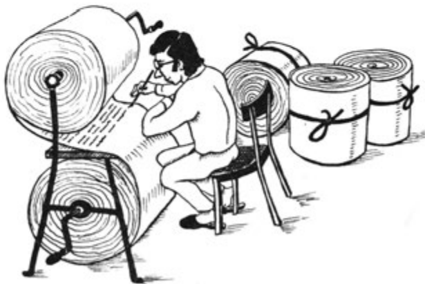
Yozuvchining ish usuli.

“Дунё бўйлаб дақиқасига ўн уч киши вафот этиши керак”.