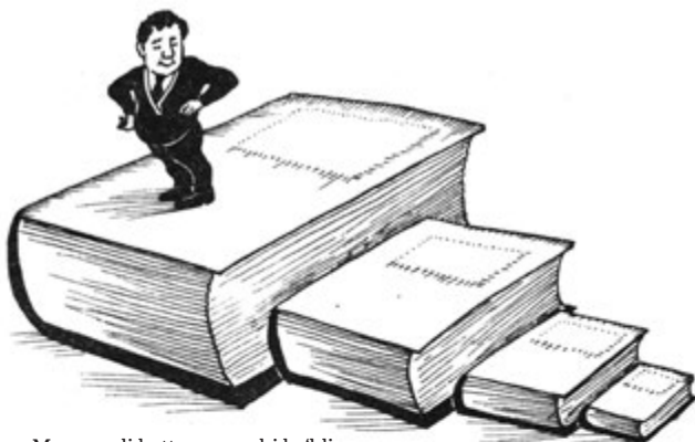
– Mana endi katta yozuvchi bo'ldim.

Хуллас, ёзувчилик махлуқотларни қутқармас экан. Адашган эканман. Хаёлимдагини тўғри деб, кўзимни каттароқ очмаган эканман.