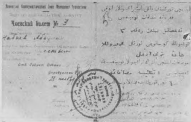
А. НАБИЕВНИНГ КОМСОМОЛ БИЛЕТИ.

— Соққи бўлмаса, ҳеч қаёққа жилмаймиз! — деди. — Буларни олиб қоламан ёки ўзим... Бойсунга бориб, аскар олиб келаман.