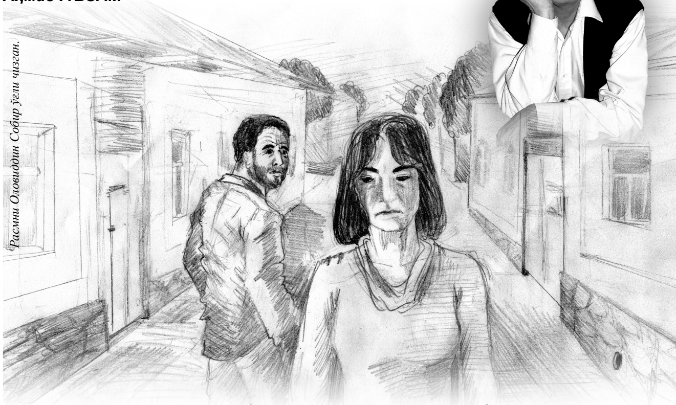
Расми Оловиддин Собир ўғли чизган.