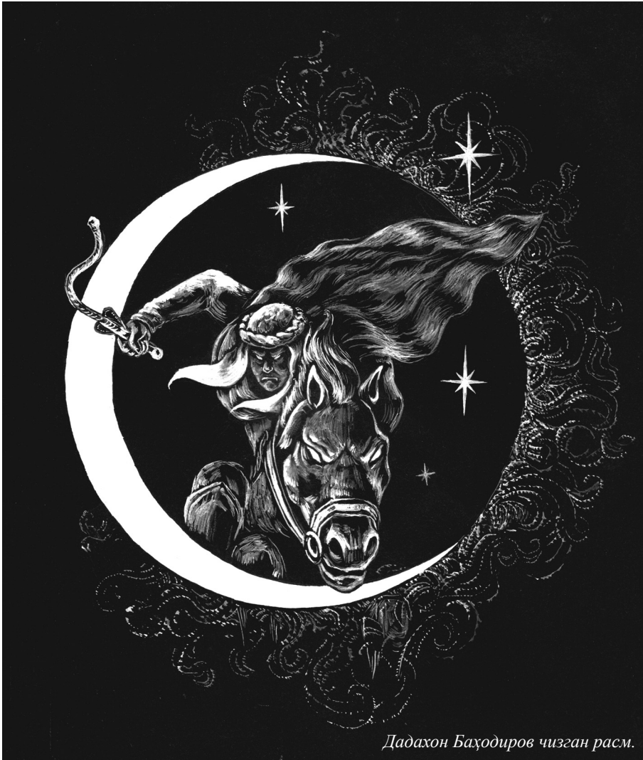
Дадахон Баҳодиров чизган расм.