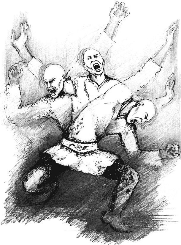
Дадахон Баҳодиров чизган расм.

Қуёш эндигина кўтарилган. Куннинг иссиқ бўлиши ҳавонинг димлигидан маълум эди. Шокир ака ҳали ҳам уйқутираб, пашша кўриб ўтирарди. У шунчалик бефарқ эдики, ҳатто бугун қайси саналигини ҳам билмасди. Беҳолгина эшикка суяниб ўтираркан, отасининг сўзлари хаёлидан кетмасди: “Бобонг жавоҳирларни шу уйнинг қаеригадир яширган. Мен бир умр изладим, аммо тополмадим. Сен топсанг, ака-укаларинг билан тенг бўлишгин. Нафсингга эрк бермагин”.