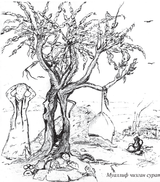
Муаллиф чизган сурат

Очликнинг азоби тутди, ҳар ким қўли-қўнжига илашганини ютди. Аввал кўкка етдик деб кўкарганнинг барисини ейишди, кейин, селдрбош ҳам қуриб қопти, энди ўлмаимиз, дейишди. Шунда ҳам арпа каплаб қанча одам шишиб ўлди. Тирик қолгани буғдой пишиғига етган бўлди.