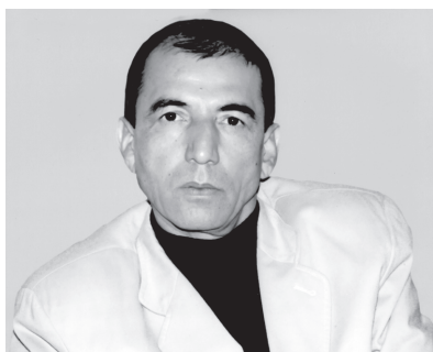
Сирожиддин САЙИД, Ўзбекистон халқ шоири