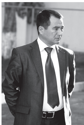
Иқбол МИРЗО, Ўзбекистон халқ шоири