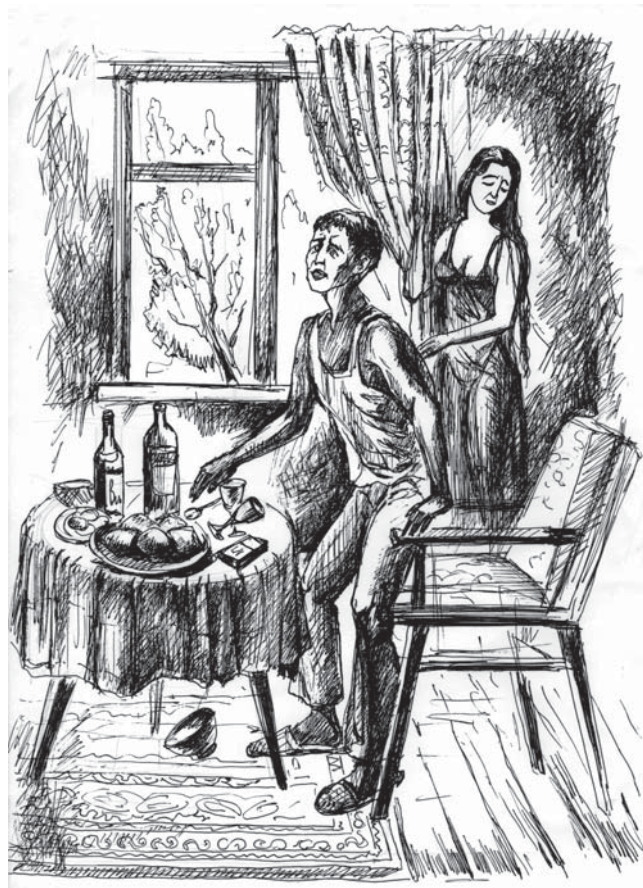
Расмларни Аслиддин Калонов чизган.

Ўша куни кун бўйи ёмғир ёғди. Бир неча кунлик