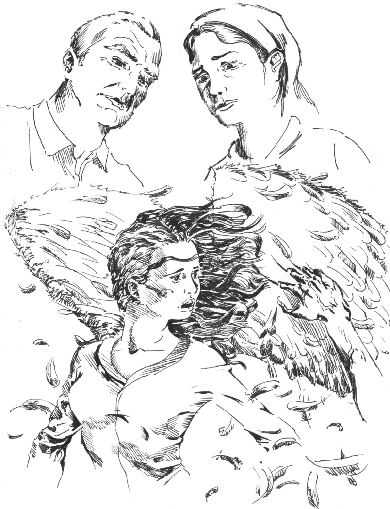
Расмларни Оловиддин Собир ўғли чизган.

– Хўп, – Ҳамида опа директорга қараб бошини қимирлатди-ю, ичидан «тинчлик