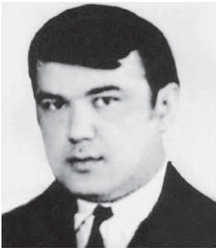
Асқар ҚОСИМОВ (1946–1986)