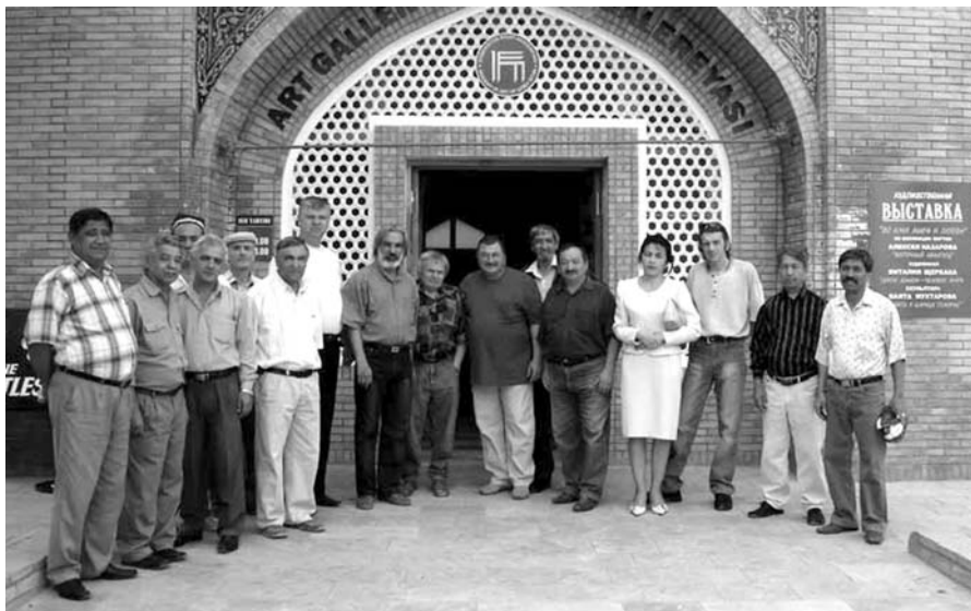
Самаркандские художники перед выставкой в Галерее «Чорсу»