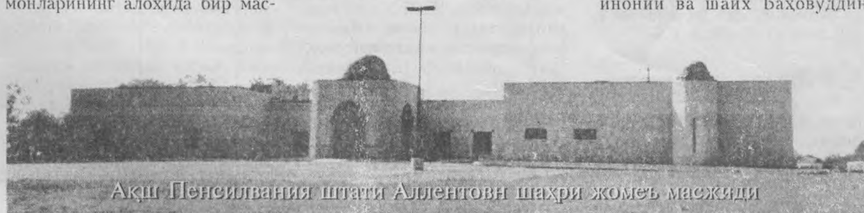
АҚШ Пенсилвания штати Аллентовн шаҳри жомеъ масжиди

Ўтган йили Ўзбекистонда биринчи марта Рамазон рўзамни ўтказдим. Албатта, Ўзбекистонда ҳам янги одатлар ва шароитларга дуч келдим. Ёш болалар эшигимга келиб Рамазон айтишлари мени хайратга солди. Отанам янги йилни нишонлаш учун Амриқога қайтиб боришимни хоҳлашган эди, лекин мен Рамазон ойини ўзбек мусулмон биродарларим ўтказдим. Бу йил яна оиламни ва она юртимни соғиниб турган бўлсам ҳам, шу ерда рўза тутиб, катта жамоатларда таровех намозларини ўқишни ниятлаганман. Ахир, ким ҳам бундай бир муборак, шарафли ойда Имом Бухорий, Имом Моғуридий, Имом Марғиноний ва шайх Баҳовуддин