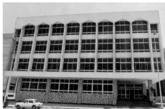
Қоҳира. Ал-Азҳар дорулфунуни кутубхонаси