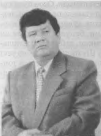
Маҳмуд ТОИР, Ўзбекистон халқ шоири