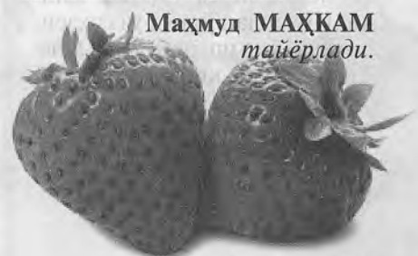
Маҳмуд МАҲКАМ тайёрлади.

— Болаларим, бир оз аввал сотувчидан жаҳлим чиққан эди. Бундай инсонлардан фақат жаҳлимиз чиқмай, уларнинг тўғри йўлни топишларини сўраб дуо қилиш бизнинг бурчимиз. Қолаверса, бугунги воқеа ҳам беҳикмат бўлмади. Баҳонада шунча нарсани билиб олдингиз. Қани, энди ҳаммамиз қўлларимизни ювиб, овқатланишга ўтираимиз.