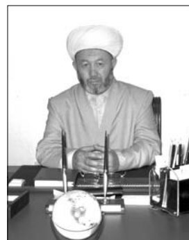
Усмонхон АЛИМОВ, Ўзбекистон мусулмонлари идораси раиси, муфтий

Аллоҳ таолога беадад ҳамду сано, Пайгамбаримизга (алайҳиссалом) дурудун салавот, саломларимиз бўлсин.