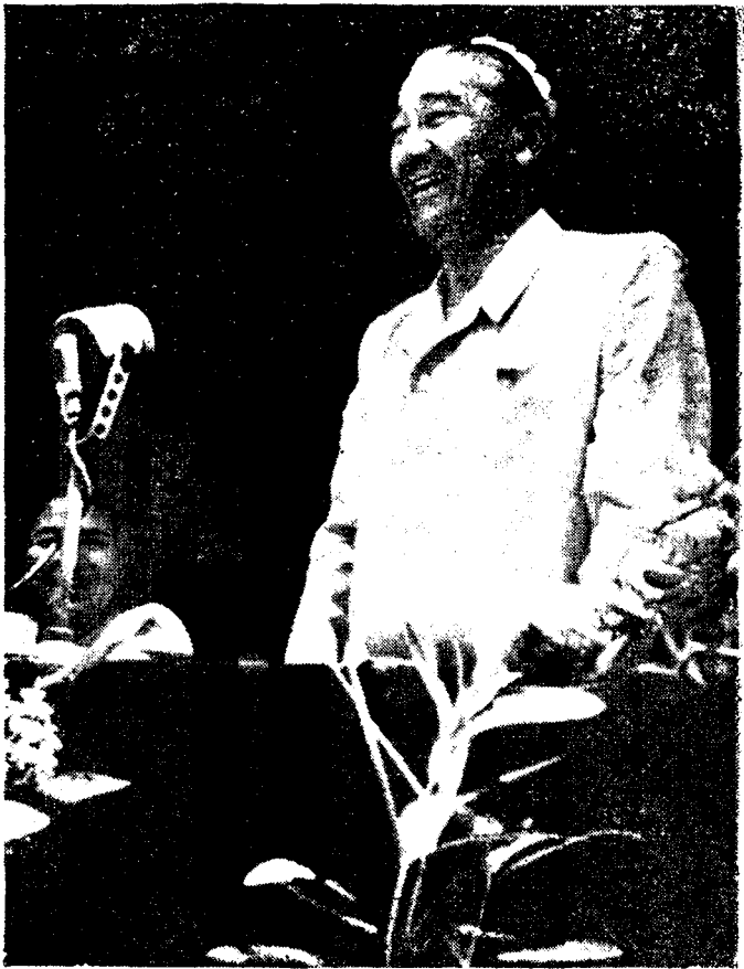
Ғафур Ғулом. 1953 йил.