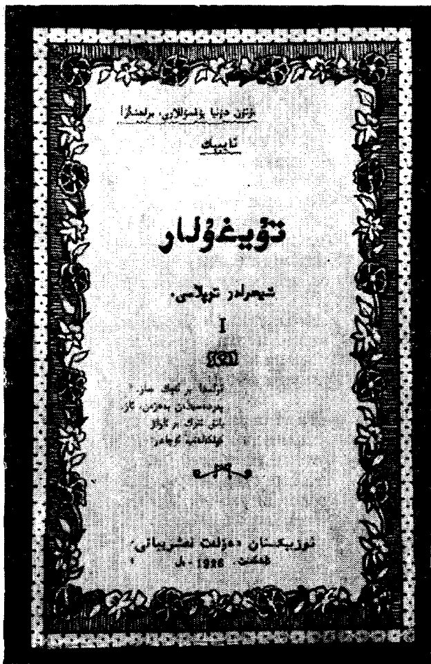
«Tuygu'lar» she'rlar kitobining mu'ovasasi. 1926 йил