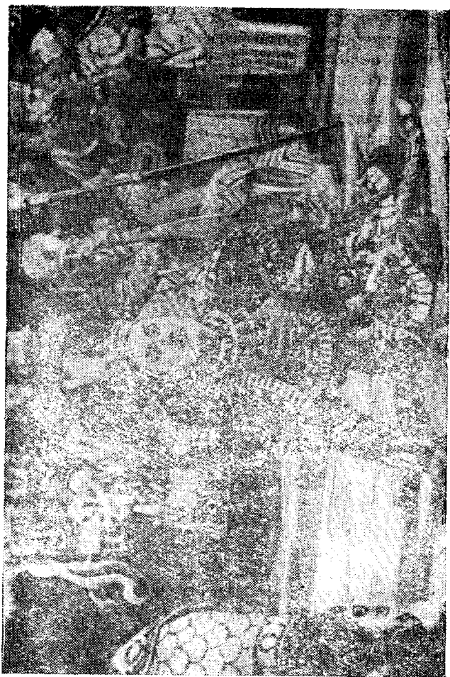
ЭЗДЕРХУС, ВО ШИРЕНДЭ СӨКТӨЛӨНДӨН БИР КҮРКИКАШ.