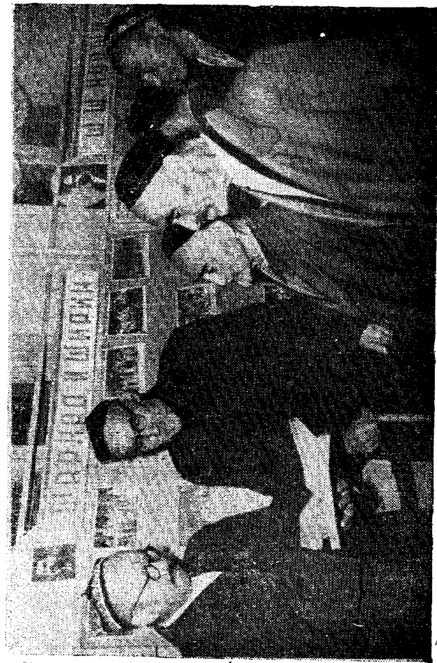
Хуршид хотирасига бағишланган виставкадан.