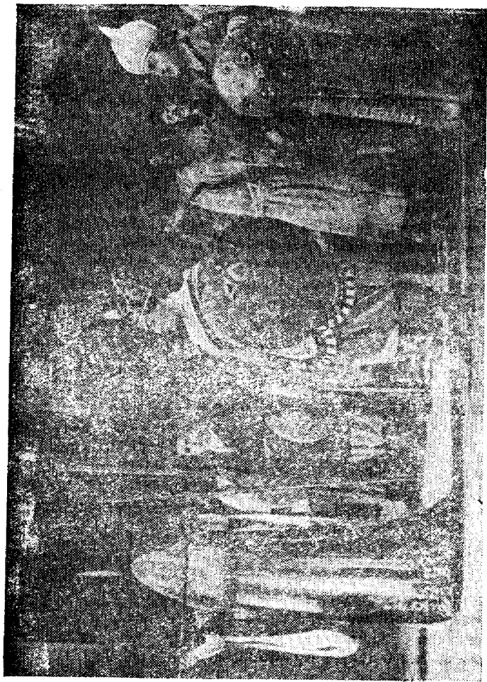
Хуршиднинг «Фарход ва Ширин» спектаклидан бир кўриниш.