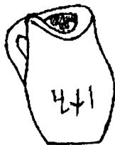
Чашмимирон қишлоғидан чиққан ивриқ чизмаси.

Муҳими, кўзачанинг қорни бўйлаб чизгилар битилган. Чамаси у кейинчалик ўткир тигли нарса билан тирнаб чизилган. Археологлар аввалига ушбу чизгиларни суғд хати бўлса керак, деб тахмин қилган эдилар. Лекин бизнинг кузатувимизча, ушбу тартибсиз чизгилар ташқи кўринишдан суғд хатини эмас, кўк турк ёзувини эслатади.